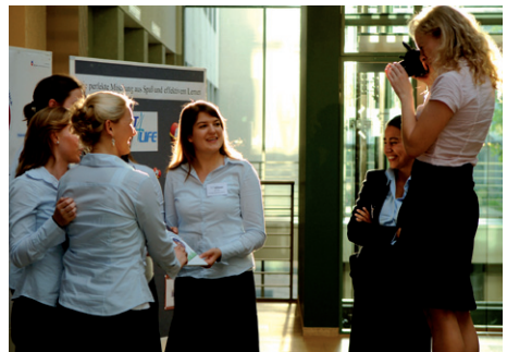
Schülerteam beim Europafinale