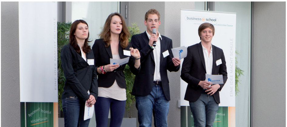
Einleuchtendes Konzept? Schüler wollen die Jury von ihrer Geschäftsidee überzeugen

Die Internetplattform sowie ein eigenes Intranet bilden die Recherche- und Kommunikationsbasis des Projekts. Schüler, Lehrer und Betreuer haben hier Zugang zu umfangreichen Informationen und Unterlagen.