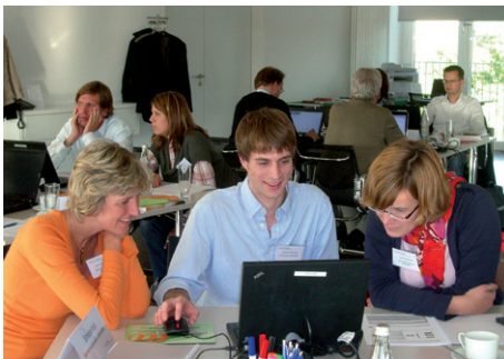
Lehrer im BWL-Seminar