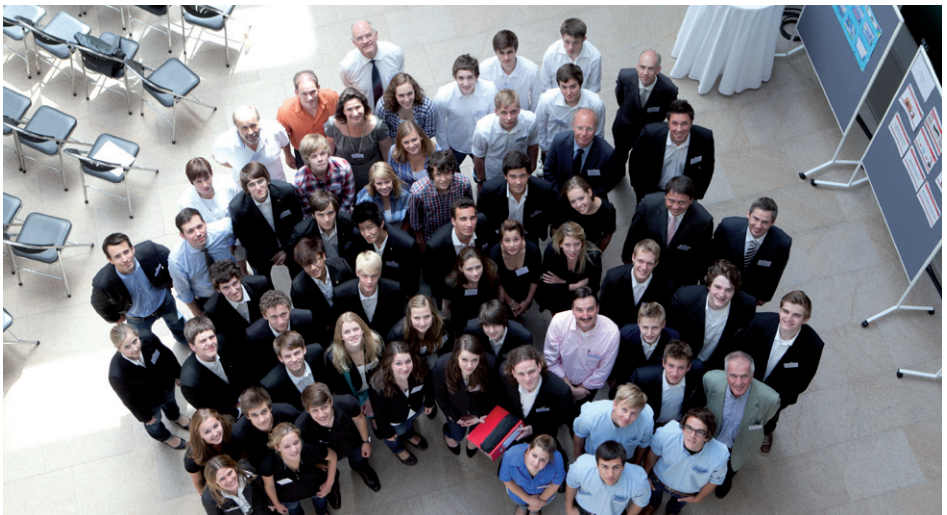
Teilnehmer beim Europafinale in München

ihrer Region. In der anschließenden dritten Phase sind die eigenen Unternehmerqualitäten gefragt: Jede Schülergruppe entwickelt eine Geschäftsidee und einen zugehörigen Businessplan, der u. a. auch ein Finanzierungskonzept beinhaltet. Bei Regionalentscheiden und einer europäischen Abschlussveranstaltung präsentieren die Jugendlichen ihre Konzepte schließlich einer Jury aus namhaften Wirtschaftsvertretern, welche die besten Geschäftsideen auszeichnet.