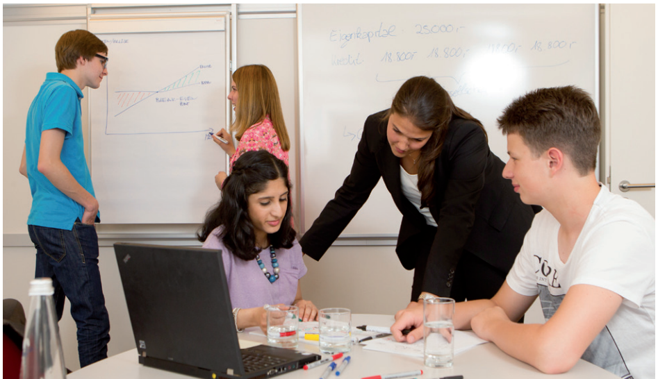
Eine Betreuerin erarbeitet gemeinsam mit ihrem Schülerteam den Geschäftsplan