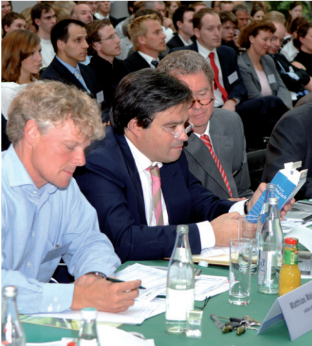
Jury begutachtet Geschäftsidee

business@school kombiniert klassische Wissensvermittlung mit neuen Formen des Lernens. Die Teilnehmer haben die Möglichkeit,