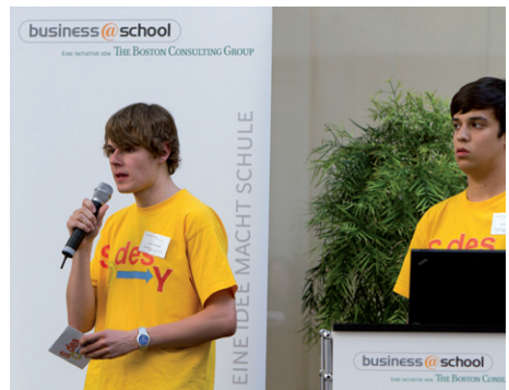
Das Team erläutert, wie „Sodesy“ funktioniert