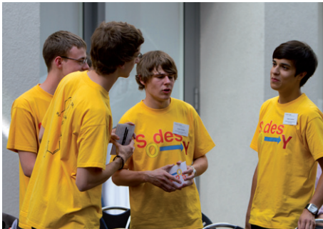
Team „Sodesy“ bereit sich auf seine Präsentation vor

Ist Umsatz gleich Gewinn? Wie berechnet man einen Break-even-Point? Was kann man einer Bilanz entnehmen und was verrät sie nicht? Antworten auf diese Fragen erhalten die vier in dem begleitenden Seminarkurs, der an ihrer Schule angeboten wird und ihre Arbeit zusätzlich unterstützt.